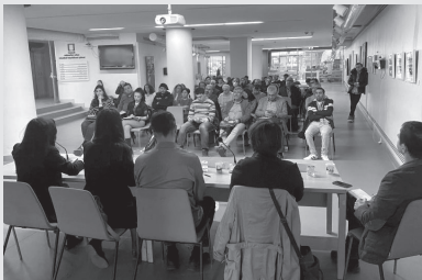
DISK-GIDA İş'in 'Seçim sürecine giderken Türkiye'de

göçmenler: Ne yapmalı, nasıl yapmalı?' adlı paneline katıldık.