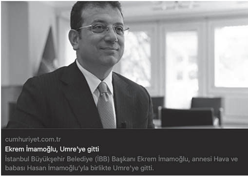
cumhuriyet.com.tr Ekrem İmamoğlu, Umre'ye gitti İstanbul Büyükşehir Belediye (İBB) Başkanı Ekrem İmamoğlu, annesi Hava ve babası Hasan İmamoğlu'yla birlikte Umre'ye gitti.

Erdoğan'ın tüm rakipleri onun silik birer kopyası.